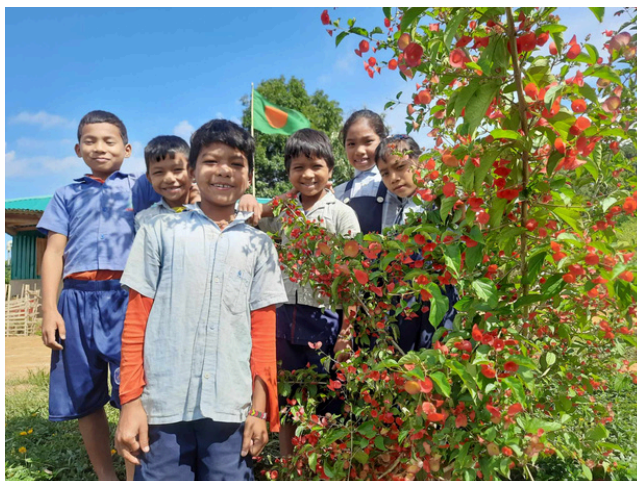
Rowa Kyan (Village School) Projekt Bangladeshis Bandarbani piirkonnas

Iga tegevus – alates vihmausside põneva maailma avastamisest kuni looduse ilu jäädvustamise ja loodusega peo pidamiseni – toetab ÜRO ökosüsteemide taastamise kümnendi eesmärke.