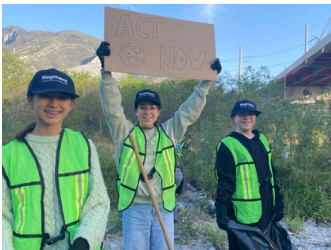
San Roberto International School, Mehhiko

Kahe nädala jooksul saavad osalejad sügavamalt mõista mulla tervise ja taimestiku rolli keskkonnaseisundi halvenemise ennetamisel ning põlvkondade vaheliste teadmiste jagamise jõudu. Läbi saadud kogemuste loovad osalejad tugevama sideme loodusega ja panustavad kestlikuma tuleviku kujundamisse.